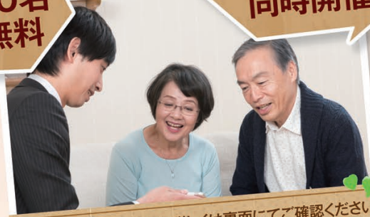
個別相談は先着順です。詳しくは裏面にてご確認ください。 ※写真はイメージです。